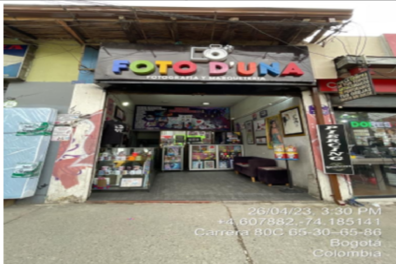
Panorámica donde se encuentra ubicado el establecimiento FOTO D'UNA , en la Carrera 80 C No. 65 - 21 Sur.