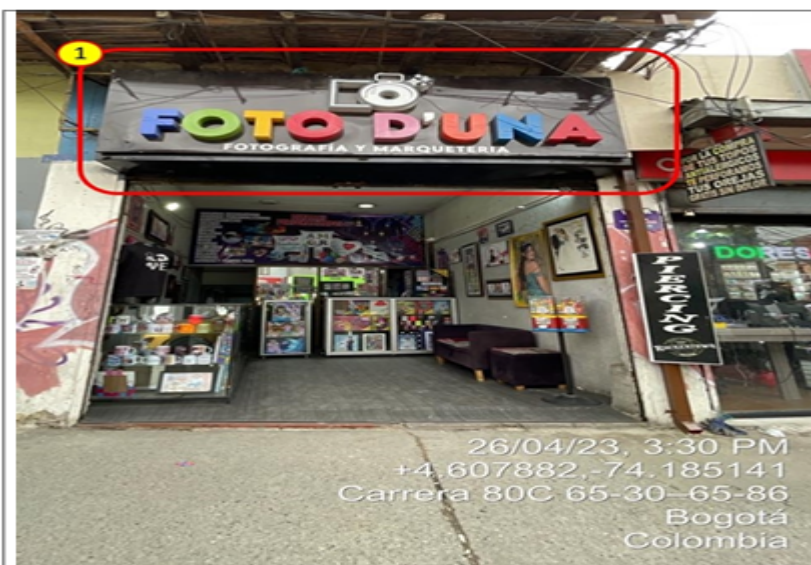
Elemento de publicidad tipo aviso en fachada, el cual no cuenta con registro de publicidad exterior visual de la SDA.